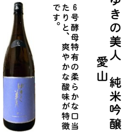
ゆきの美人 純米吟醸 愛山

※数量限定品です。 ※入荷は遅れる場合がございます。 ※吹き出しにご注意下さい。