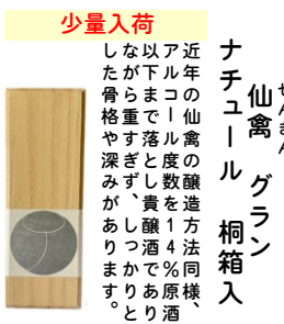
ナチュール 桐箱入

近年の仙鶴の醸造方法と同様、以下で落ちる酒を14%原酒しながら重さや深みがあります。