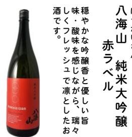
八海山 純米大吟醸