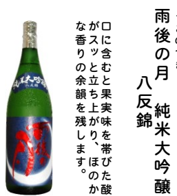
この酒のついでに 雨後の月 八反錦 純米大吟醸

※数量限定品です。 ※入荷は遅れる場合がございます。 ※吹き出しにご注意下さい。