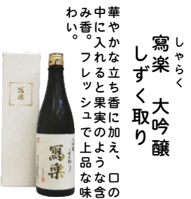
しやらく 寫楽 大吟醸 しずく取り 華やかな立ち香に加え、口の中に入れると果実のような味わい。フレッシュで上品な味含み。