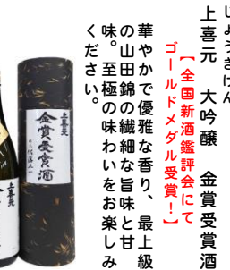
じょうきげん 上喜元 大吟醸 金賞受賞酒 (全国新酒鑑評会にて「ゴールドメダル受賞」) 華やかで優雅な香り、最上級の山田錦の繊細な旨味と甘み。至極の味わいをお楽しみください。