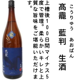
こうりゅう あおばん 高麗 藍判 生酒 上槽後100日間マイナスイオンで管理。柔らかいキレと上質な旨味をご堪能いただけます。