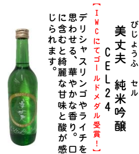
びじょうふ セル 美丈夫 純米吟醸 CELLE 24 (IWCにてゴールドメダル受賞!) デリシヤスリングやライチを思わせる、華やかな香りに含むと綺麗な甘味と酸が感じられます。