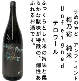
うめのやび アンフエインド 梅乃宿 純米 Ume no Ya Bi テロワール

※数量限定品です。 ※入荷は遅れる場合がございます。 ※吹き出しにご注意下さい。