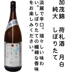
かもしき 加茂錦 荷札酒 月白 純大 しほりたて 淡麗で辛口。瑞々しい味わい。しほりたての繊細な香味をお楽しみください。