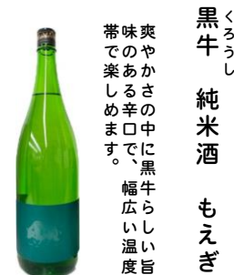
くろひし 黒牛 純米酒 もえぎ 爽やかなさの中に黒牛らしい旨味のある辛口で、幅広い温度帯で楽しめます。