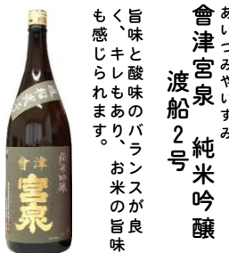
あいづみやいずみ 會津宮泉 純米吟醸 渡船2号 旨味と酸味のバランスが良く、キレもあり、お米の旨味も感じられます。