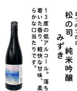
まつのつかさ 松の司 純米吟醸 みずき 13度の低アルコール。落ち着いた香り、軽やかな甘味、柔らかい口当たりです。