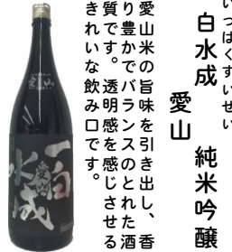
いっばくすいせい 一白水成 純米吟醸 愛山米の旨味を引き出し、香り豊かでバランスのとれた酒質です。透明感を感じさせるきれいな飲み口です。