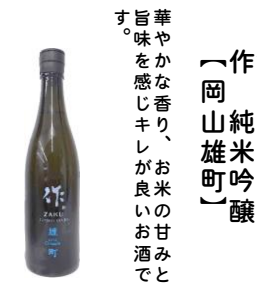
さかみ 作く 純米吟醸 〔岡山雄町〕 華やかな香り、お米の甘みと旨味を感じキレが良いお酒です。