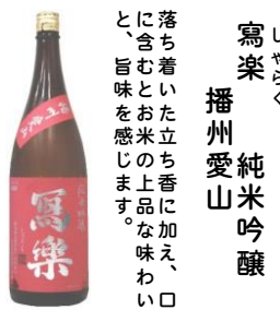
しやらく 寫楽 純米吟醸 播州愛山 落ち着いた立ち香に加え、口の中に入れると果実のような味わいと、旨味を感じます。