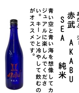
あかぶ シー 赤武 AKAABU 純米 青い空と青い海を想像してカジュアルに楽しんでください。がオースメです。