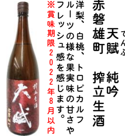
てんぶ 赤磐雄町 純吟 搾立生酒 洋梨、白桃、トロピカルフルーツの様な果実味の甘さやフレッシュ感を感じます。 ※賞味期限 2022年8月以内